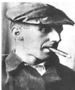
Bertolt Brecht (1898-1956)

In entrambi i casi, che vinca l'assurdo o il pessimismo nichilista, la questione della verità viene negata, rimossa e resa inessenziale: eletti l'assenza di senso e l'assurdità dell'esistenza a nocciolo fondante della poetica beckettiana, alla verità non resta che farsi da parte per lasciare il campo all'ironia o alla rassegnazione.