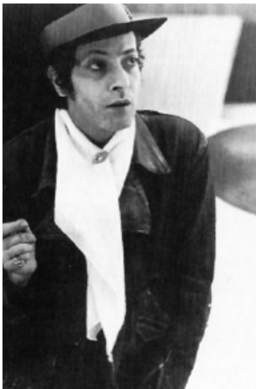
Leo De Berardinis, Assoli (1977)

LIVIO. Ecco, c'è qualcosa che mi pare importante. Cioè questa faccenda dell'arrivo a Marigliano. Queste cose succedono perché manca un po' di spazio, per il tipo di